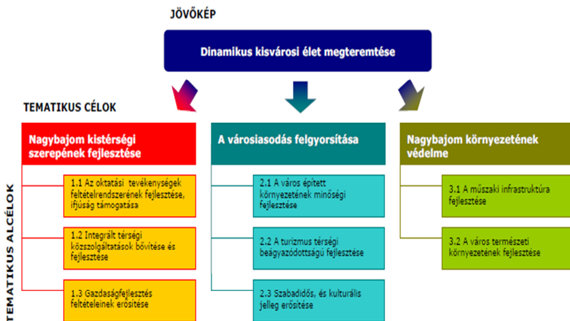
2. ábra: Nagybajom város jövőképe és tematikus céljai